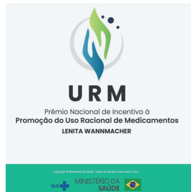
Figura 2. Folder de chamada para inscrições no V Prêmio.

camentos; (ii) de pesquisadores e profissionais com trabalhos voltados para a promoção do Uso Racional de Medicamentos com aplicabilidade no sistema e serviços de saúde; e (iii) para divulgar os trabalhos premiados e com menção honrosa com a intenção de incentivar sua incorporação pelo Sistema Único de Saúde (SUS). Isto é feito através do Prêmio Nacional de Incentivo à Promoção do Uso Racional de Medicamentos Lenita Wannmacher (Figura 2).