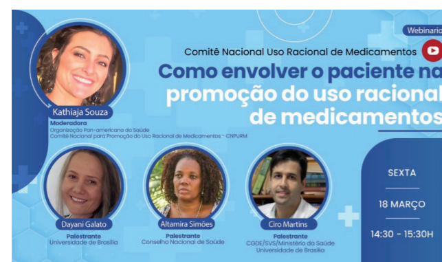
Figura 1. Convite para webinar do CNPUM (2022)

Prêmio Nacional de Incentivo à Promoção do Uso Racional de Medicamentos Lenita Wannmacher. Uma das principais atividades do CNPUM são a premiação e reconhecimento do mérito de (i) trabalhos profissionais em serviços de saúde e entidades/instituições com impacto na promoção do Uso Racional de Medi-